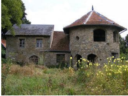
C'est un peu grand ...