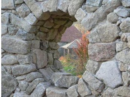
Vue de la fenêtre ronde dans la tour